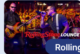
Rolling Stone Lounge