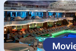
Movies on Board